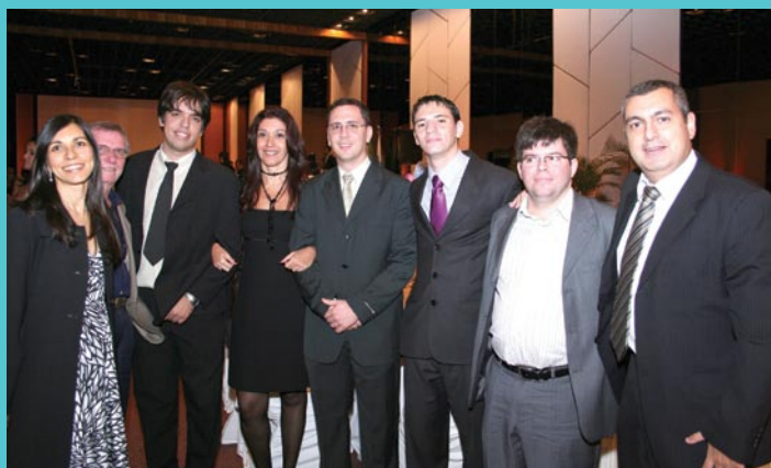
Os novos fiscais compareceram para prestigiar a festa da Associação que os representa e reencontraram colegas do curso de capacitação