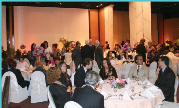
O salão repleto de amigos em confraternização pelo aniversário da AFRERJ, em ambiente com música ao vivo